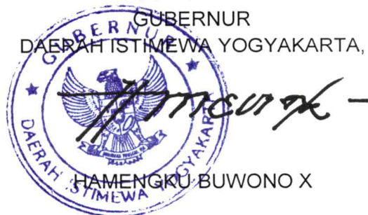
HAMENGGU BUWONO X